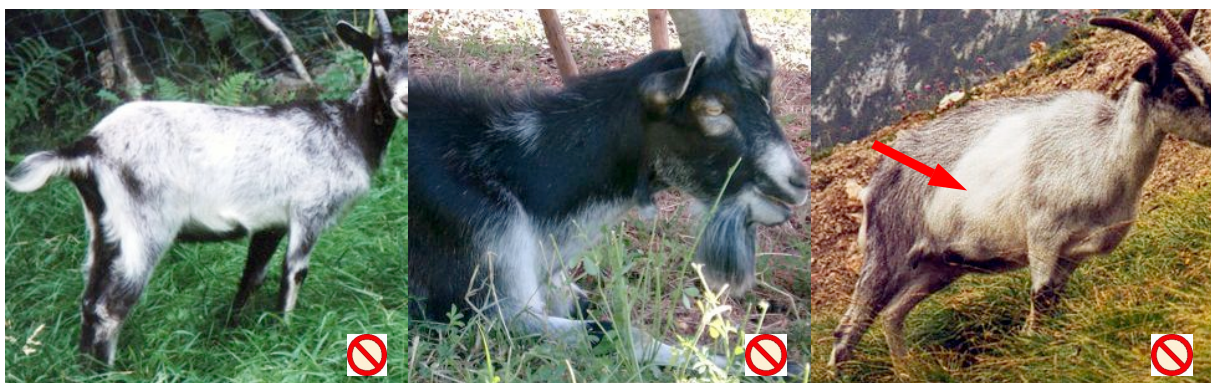
Zu hell, schwarze Flecken Trop claire, taches noires Troppo chiaro, macchie nere