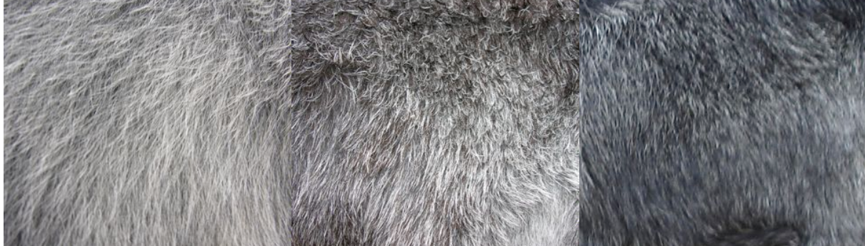
silbergrau / gris argenté / grigio argentato grau meliert / gris chiné / grigio screziato dunkelgrau meliert / gris foncé chiné / grigio scuro screziato